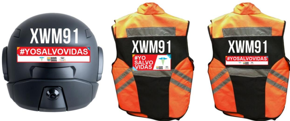
Imagen 02: Marcación de referencia de vehículos de tipo motocicleta, tricimoto o cuatrimoto.

Parágrafo 2. La señalética para vehículos tipo motocicleta, tricimotos y cuatrimotos constará como mínimo de una marcación mediante adhesivo ubicado en la parte posterior del casco, así como de la parte posterior del chaleco reflectivo, indicando claramente que pertenece al personal médico y/o de salud. A lo anterior, se presenta el siguiente modelo: