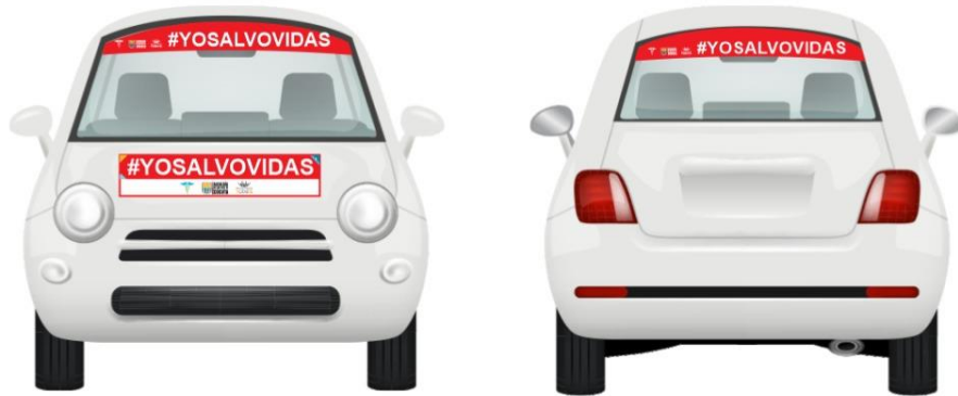
Imagen 01: Marcación de referencia de vehículos tipo automóvil o camioneta.

Parágrafo 2. La señalética para vehículos tipo motocicleta, tricimotos y cuatrimotos constará como mínimo de una marcación mediante adhesivo ubicado en la parte posterior del casco, así como de la parte posterior del chaleco reflectivo, indicando claramente que pertenece al personal médico y/o de salud. A lo anterior, se presenta el siguiente modelo: