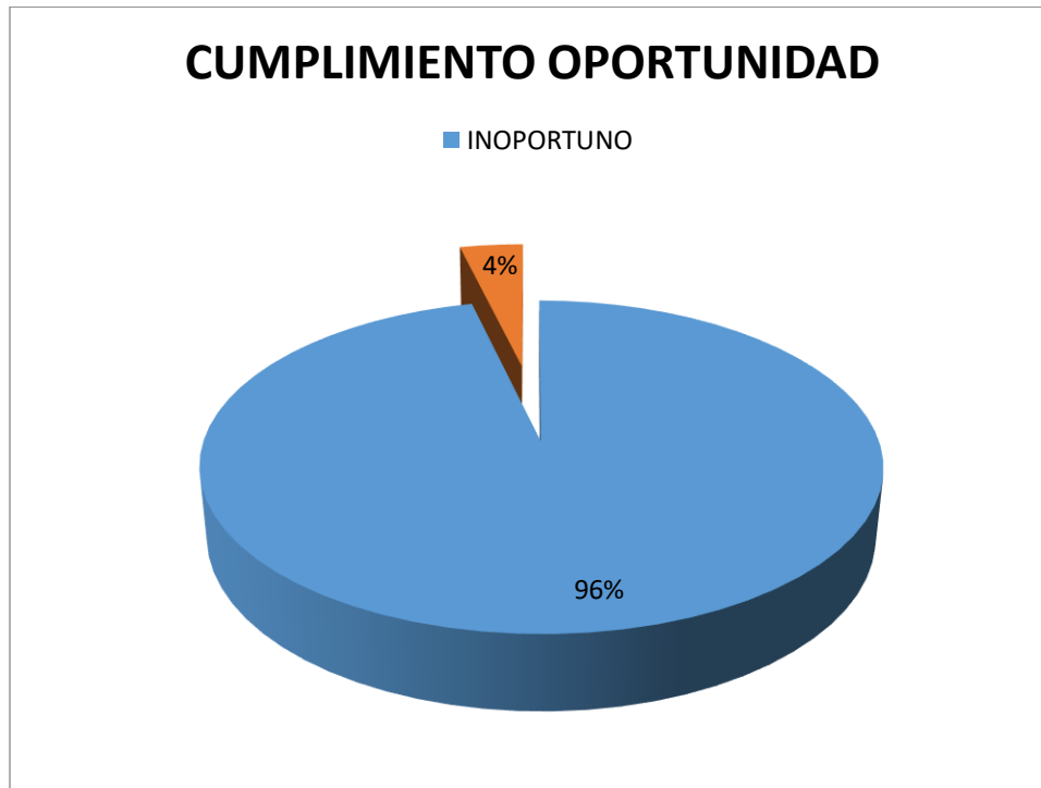
Figura 2. CUMPLIMIENTO DE ENVIO OPORTUNO DE INFORME SEGUIMIENTO P.Q.R.S.D.F PRIMER SEMESTRE 2018