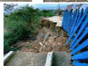
Estudios y diseños de obras de estabilización sector calle 7 N°18-103 del Barrio 28 de Febrero.