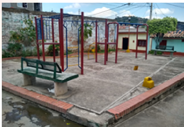
Intervención en Parque. Ubicado en la calle 6 entre avenidas 13 y 14 del Barrio Loma de Bolívar.

Información diaria de los avances y las gestiones del alcalde Jairo Yáñez