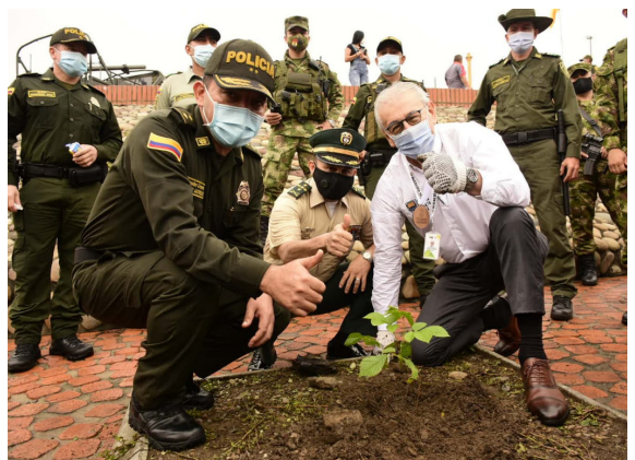
En el marco de la iniciativa 'Lo Juro, un Voto, un Árbol' el alcalde Jairo Yáñez junto al Comandante de Policía Metropolitana de Cúcuta - Brigadier General Oscar Antonio Moreno Miranda y al Comandante de Trigésima Brigada del Ejército Nacional, Coronel Iivar Orlando González Villamil, plantaron su árbol en conmemoración de los 208 años de la Batalla de Cúcuta.