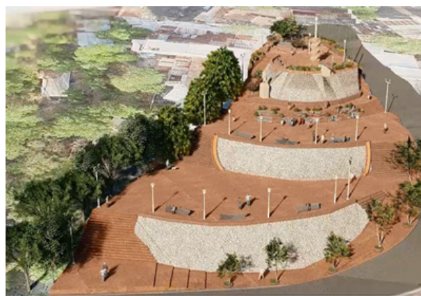
Vista Aérea Loma de Bolívar.