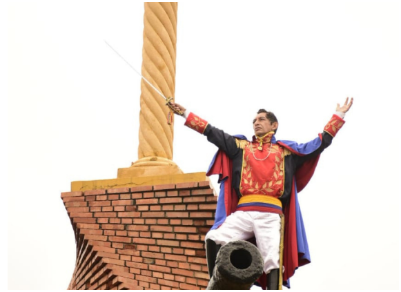
Cada 28 de febrero se conmemora la máxima fiesta patria "La Batalla de Cúcuta", día en que el ejército de Simón Bolívar vence las tropas invasoras españolas al mando del general Ramón Correa.