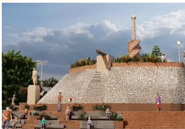
Nueva Fachada Monumento Loma de Bolívar.

INVERSIÓN ESTIMADA DE $299.870.000 PESOS