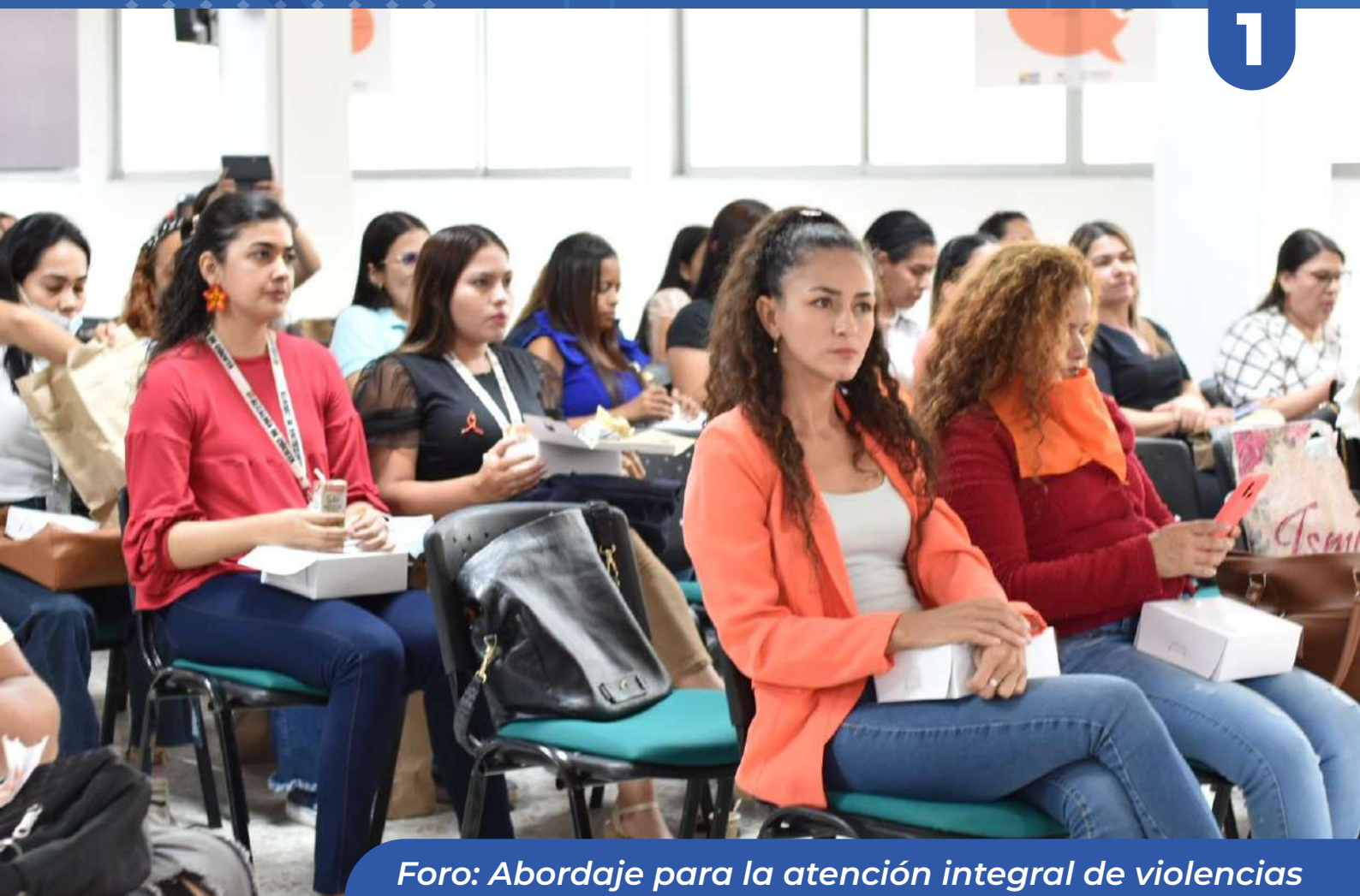
Foro: Abordaje para la atención integral de violencias basadas en género en la zona de frontera