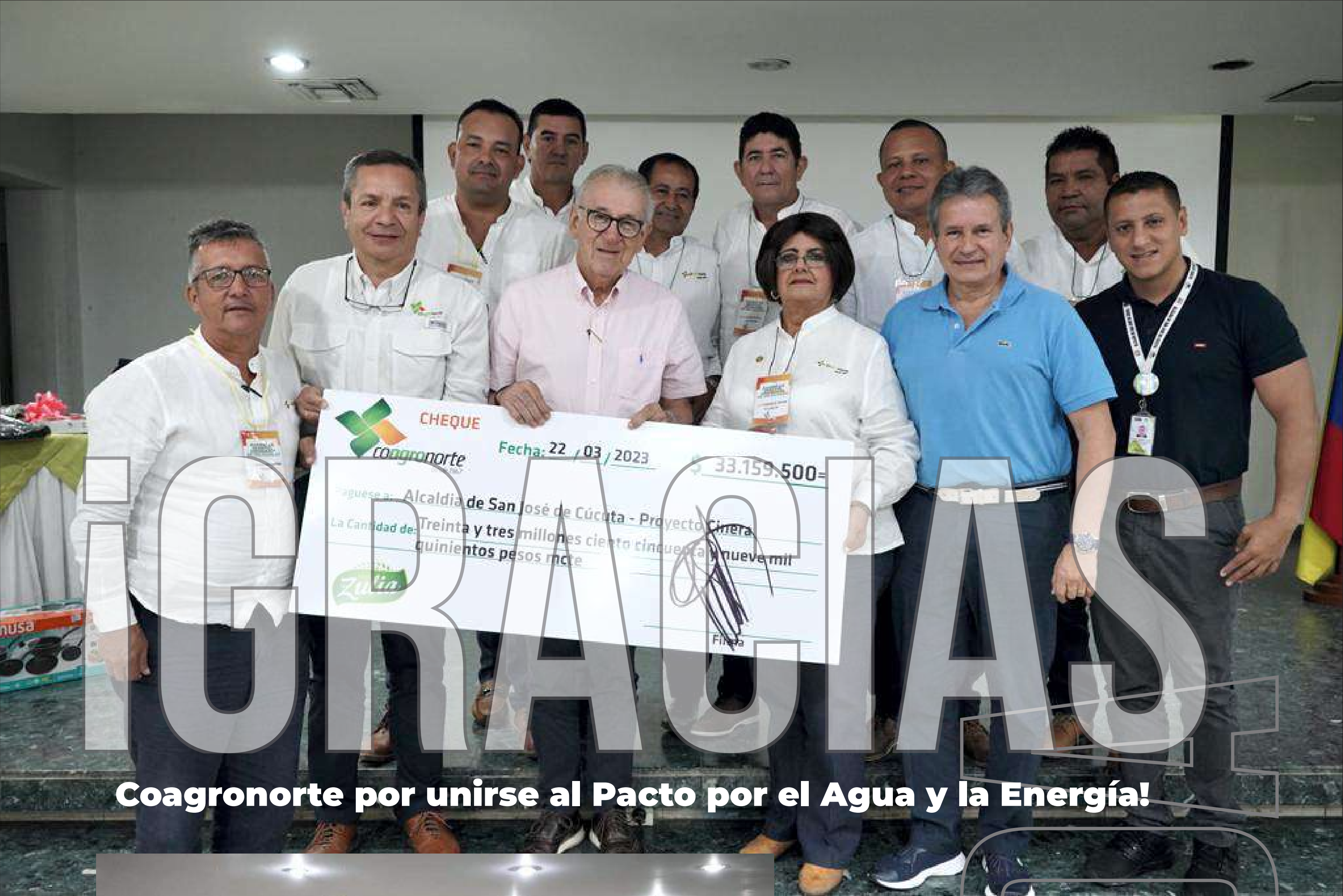
Coagronorte por unirse al Pacto por el Agua y la Energía!