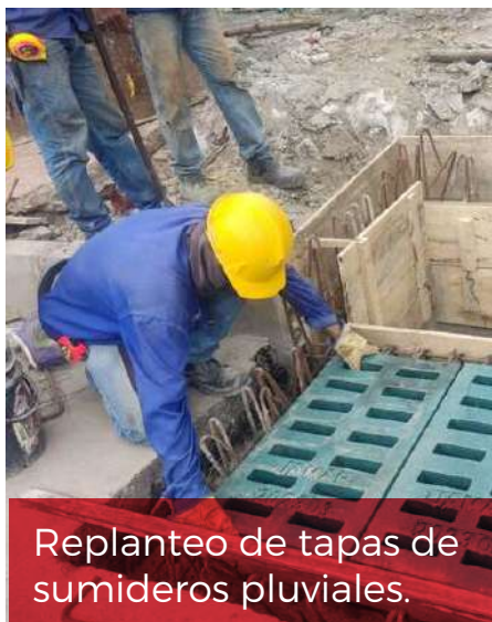
Replanteo de tapas de sumideros pluviales.