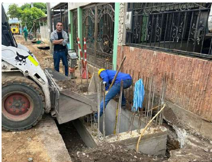
Instalación se sub base alrededor de sumidero lateral S12.