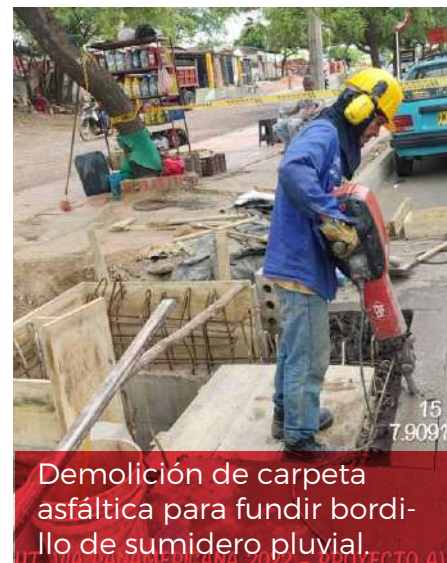
Demolición de carpeta asfáltica para fundir bordillo de sumidero pluvial.