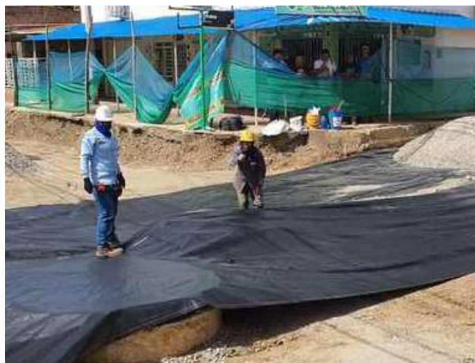
Se inician actividades de instalación de Geotextil T2400 en intersección de Av 7 con Calle 8.