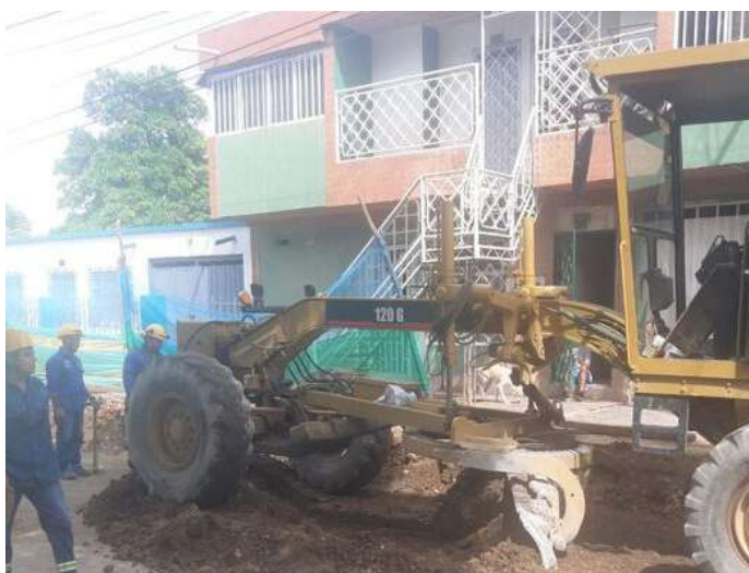
Nivelación de la subrasante para iniciar con la subbase.