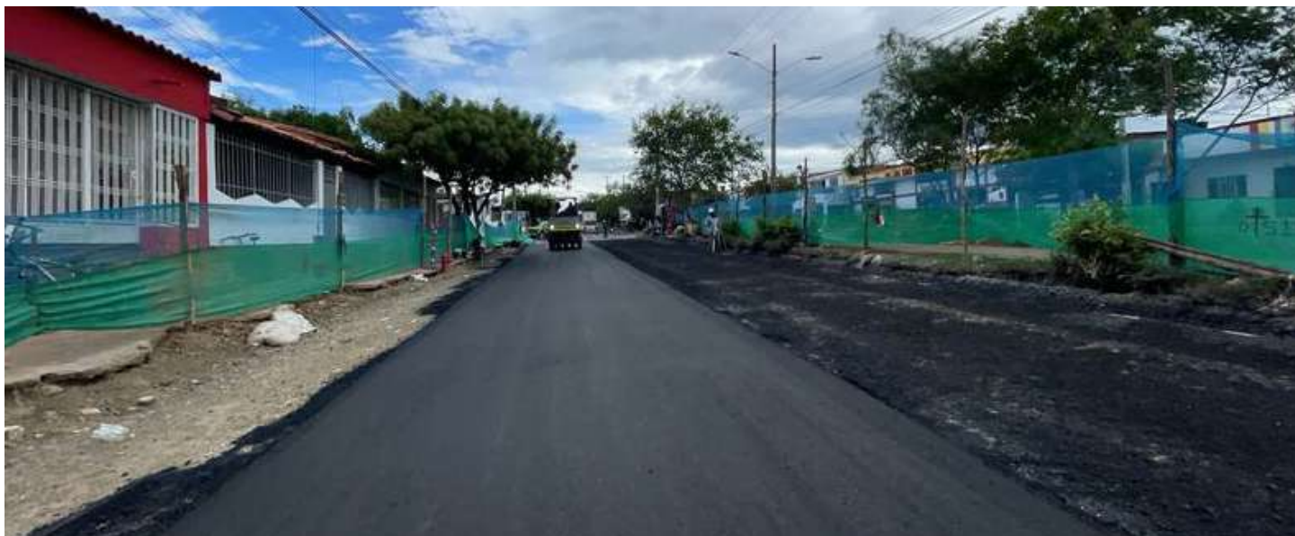
Instalación de Mezcla asfáltica densa en caliente (Segunda capa).