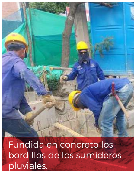
Fundida en concreto los bordillos de los sumideros pluviales.