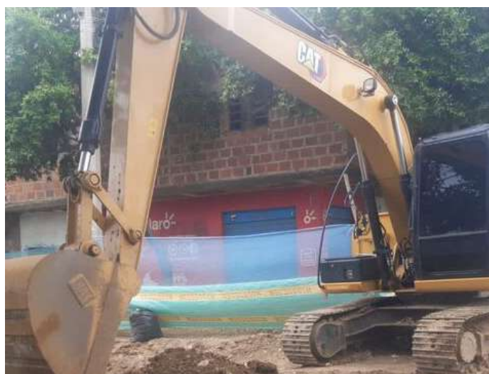
Se realiza en cajeo para la nivelar la subrasante para instalación de pavimento.