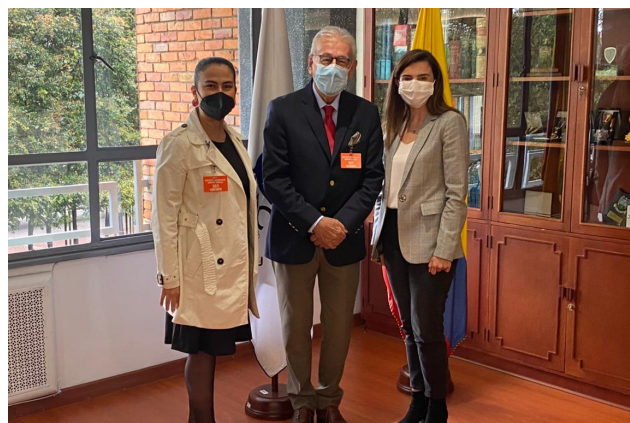
Con el respaldo del sistema de información catastral, al que accederá la Alcaldía, se podrán tomar decisiones ajustadas a la realidad del territorio. El municipio podrá migrar toda la data recibida del IGAC, desde la plataforma COBOL, hacia el Sistema Nacional Catastral.