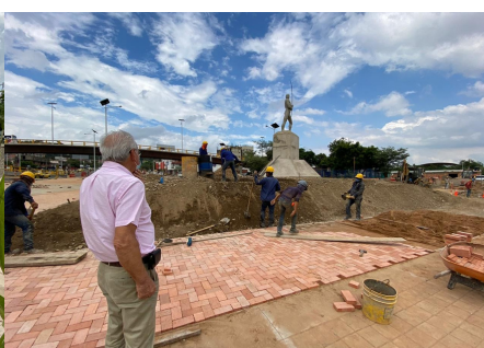
Proyección inicial de la megaobra.