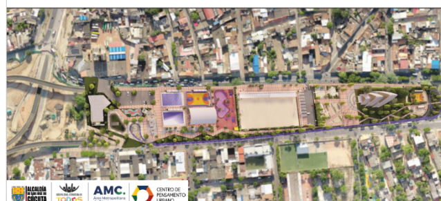
Fotografía Render Parque Lineal Avenida Sevilla. Imagen proporcionada por el Centro de Pensamiento Urbano del Área Metropolitana de Cúcuta.

Para la recuperación de la malla vial se estima una inversión aproximada de 160 millones de pesos, con una mejora en 1.430 m 2 de vías, así como la terminación total de las obras para finales de este mes de marzo de 2021.