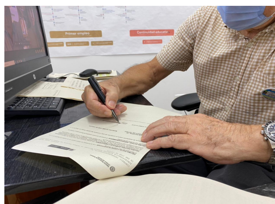
Firma del acuerdo entre La Alcaldía de Cúcuta y la Agencia Nacional de Defensa Jurídica del Estado.