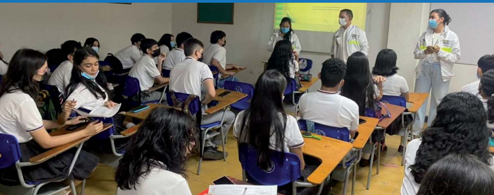
Estudiantes de los grados 8vo y 9no del colegio Divina Pastora, sede La Fortaleza

Con charlas y conferencias seguimos llegando a los estudiantes de las instituciones educativas donde se han presentado situaciones de riesgo por el consumo de medicamentos respondiendo a retos de redes sociales, explicando los riesgos que estas prácticas pueden generar en su salud.