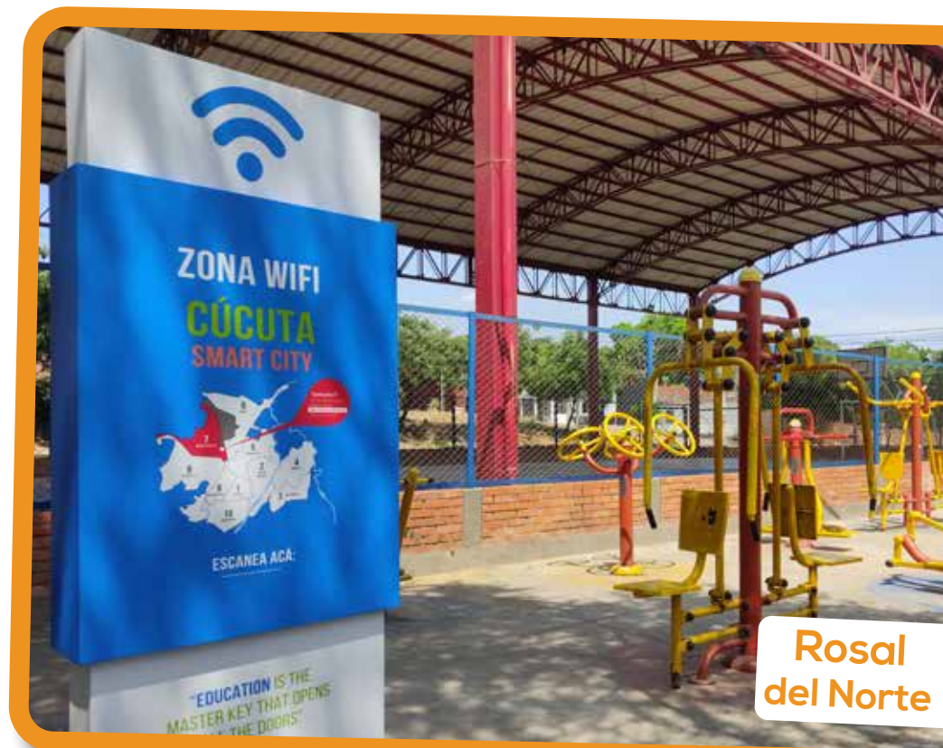
Rosal del Norte

sesiones fueron registradas durante la primera jornada de este proyecto, iniciativa de la Alcaldía de Cúcuta, la Oficina TIC y el Centro Tecnológico de Cúcuta CTC.