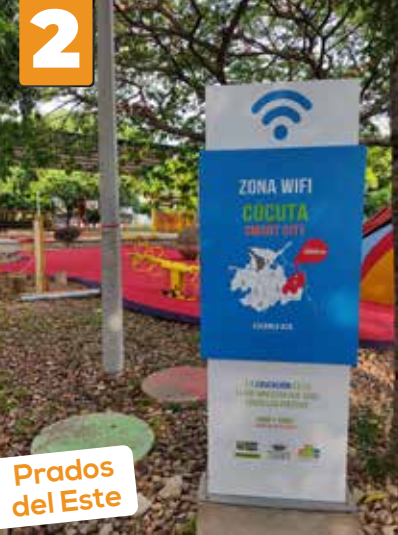
Prados del Este